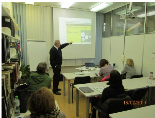
Mihelič: »Spletna animacija za učenje esperanta od Petra Grbca....«

Krožek je potekal v tkim. »Zamenhovem letu«, zato je bil še posebej pomemben, saj je predstavljal eno od oblik obeleževanj letošnjih pomembnih obletnic v gibanju za esperanto: 130-letnici mednarodnega esperantskega gibanja, 100-letnici smrti utemeljitelja esperanta, Ludvika Lazara Zamenhova, 110-letnici esperanta na Slovenskem in 80-letnici Združenja za esperanto Slovenije.